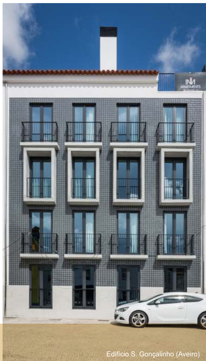
Edifício S. Gonçalinho (Aveiro)